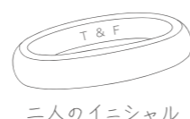
二人のイニシャル