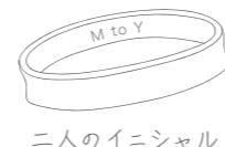
二人のイニシャル