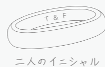
二人のイニシャル