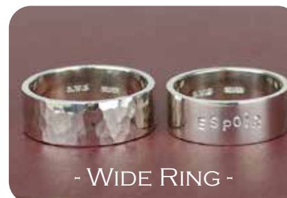
- WIDE RING -