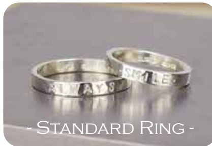
- STANDARD RING -

シンプルで着けやすく、馴染みやすいボリューム感！ オプションのリングホルダーに掛けてペンダントトップにも！