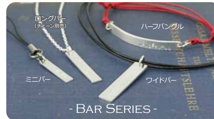
ロングバー (チェーン別売)