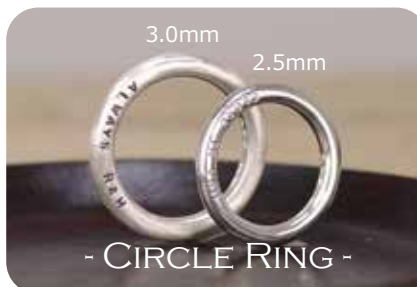
- CIRCLE RING -