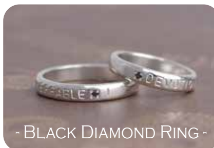
- BLACK DIAMOND RING -