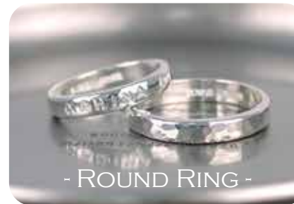
- ROUND RING -