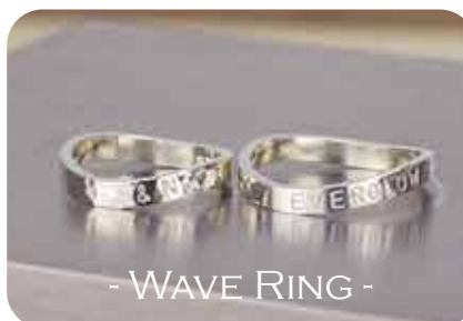
- WAVE RING -