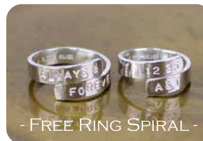
- FREE RING SPIRAL -